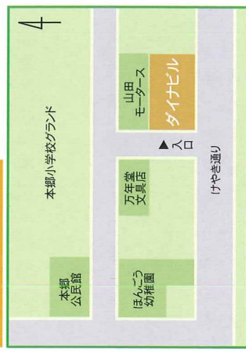
ダイナビル案内図 本郷公民館の南東です

主催: 株式会社 ダイナ建築設計 http://www.daina-ae.com/